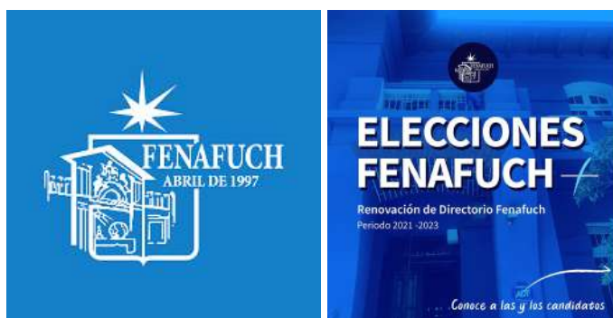
Imagen del logo de la FENAFUCH al costado izquierdo e imagen del proceso electoral del Directorio 2021-2023 al costado derecho.

Además, contamos con una instancia formal de diálogo con representantes del entorno significativo local, la cual se llama "Escuelas de Temporada" de la Vicerrectoría de Extensión y Comunicaciones - VEXCOM 5 . Iniciativa realizada anualmente que incluye talleres y mesas de participación para actores del entorno local, regional y nacional.