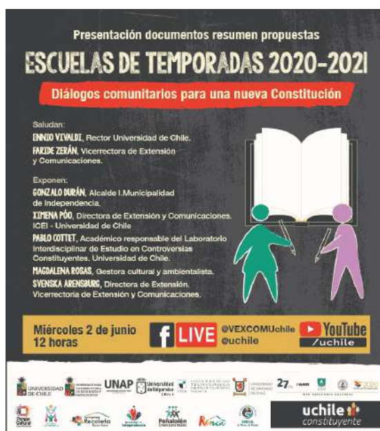
Imagen de actividad de presentación de las sistematizaciones de Escuelas de temporada 2020-2021 Diálogos comunitarios para una nueva Constitución.

Además, contamos con una instancia formal de diálogo con representantes del entorno significativo local, la cual se llama "Escuelas de Temporada" de la Vicerrectoría de Extensión y Comunicaciones - VEXCOM 5 . Iniciativa realizada anualmente que incluye talleres y mesas de participación para actores del entorno local, regional y nacional.