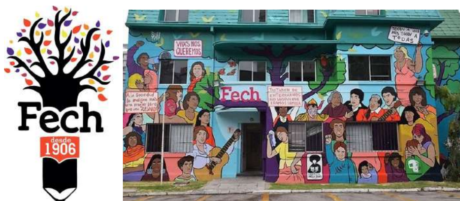
Imagen del logo de la FECH al costado izquierdo e imagen de la fachada de la federación ubicada en el Campus Andres Bello al costado derecho.

El primero de ellos asociado al estamento estudiantil , se encuentra la Federación de Estudiantes de la Universidad de Chile - FECH 2 , instancia de representatividad para el conjunto de estudiantes el cual fue fundado en el periodo de 1906-1907 para reivindicar el rol de la organización estudiantil, y desde esa fecha ha sido gestora y partícipe activa de la historia de la Universidad y el país.