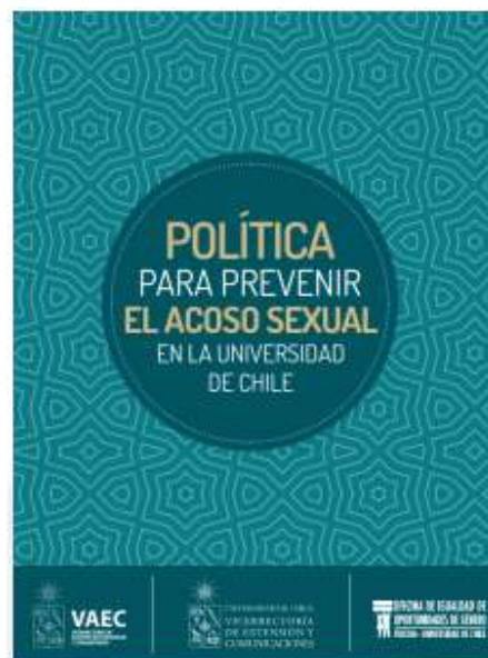
Imagen de la portada de la Política para Prevenir el Acoso Sexual en la UCh.

La Universidad de Chile desde el 2012 ha estado trabajando en este ámbito con la creación de la Comisión de Igualdad , luego al siguiente año se crea la Oficina de Igualdad de Oportunidades de Género . Y desde el 2017 comienza el Plan de Desarrollo Institucional con Perspectiva de Género (2017-2022) , siendo el primer hito la aprobación en el Senado Universitario de la Política para Prevenir el Acoso Sexual 16 , la cual tiene como objetivo erradicar el acoso sexual y reducir la violencia de Género en la Universidad de Chile a partir de un programa que permita prevenir estas conductas y atender a las personas afectadas.