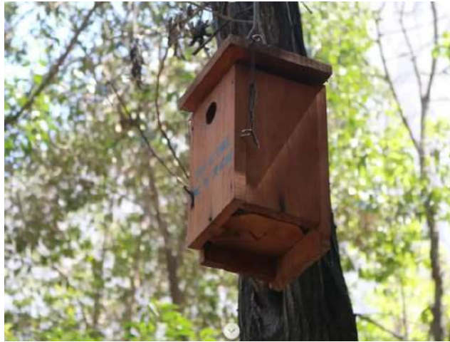
Imagen de las cajas anideras instaladas por integrantes de la Facultad de Ciencias.