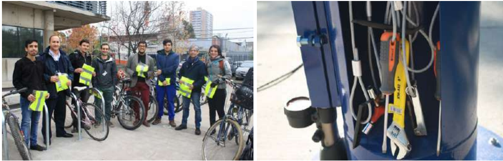
Imagen de la inauguración del nuevo bicicleta de la Facultad de Odontología.