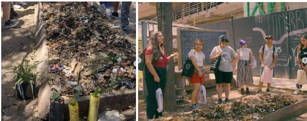
Imágenes del lecho de lombricultura del Proyecto La Lombri de la Facultad de Ciencias.

En el Campus Juan Gómez Millas, se encuentra el Proyecto La Lombri de la Facultad de Ciencias, los cuales realizan manejo de residuos orgánicos en un lecho destinado a la lombricultura.