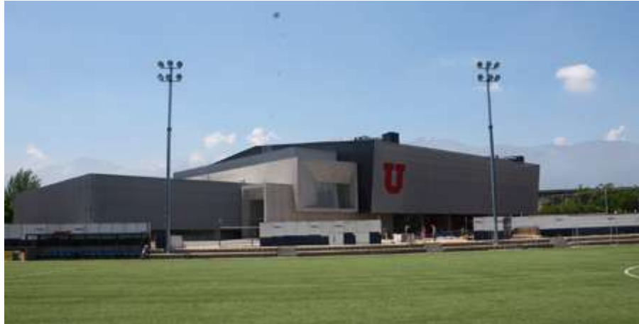
Imagen del Campo Deportivo JGM.

una pista de Atletismo, una Multicancha y canchas de pasto sintético para futbolito y hockey césped. Adicionalmente, en el edificio Polideportivo Juan Gómez Millas podemos encontrar una cancha polideportiva central con galería retráctil, una piscina semiolímpica temperada, un gimnasio de musculación, una sala de baile multiuso, una sala para práctica de deportes de combate, tenis de mesa y deportes mentales.