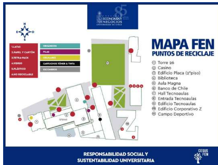
Imagen del Mapa de los Puntos de Reciclaje en FEN

paulatinamente en instalación de puntos verdes , reciclador para el manejo de los residuos, centro de acopio , contenedores adecuados a los diferentes espacios y planes de mejora continua.