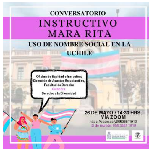
Imagen de uno de los conversatorios en torno al Instructivo Mara Rita en la Facultad de Derecho durante el 2021.

También se crea la Dirección de Igualdad de Género (DDIGEN) 17 , la Comisión de Género y Diversidades del Senado Universitario, Unidades o Direcciones de género en diversas facultades e institutos, y la creación de la Unidad de Investigaciones Especializadas en Acoso Sexual, Acoso Laboral, y Discriminación Arbitraria .