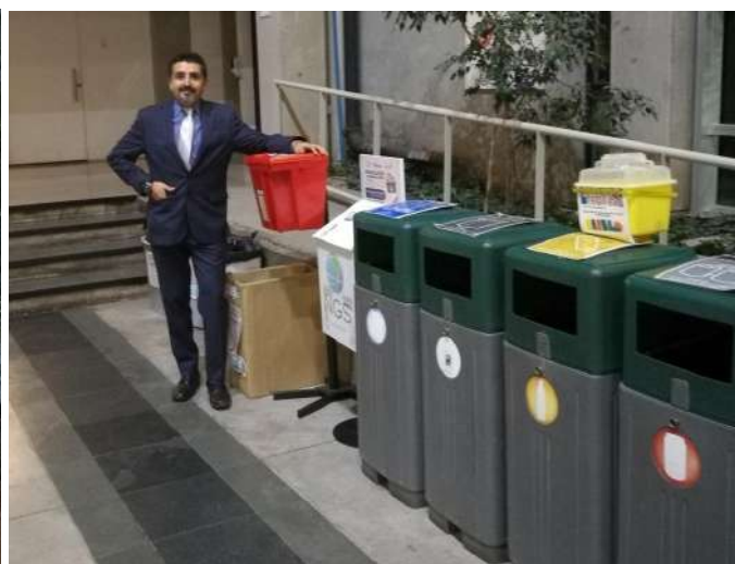
Imágenes de dos puntos limpios FEN Recicla (interior a la derecha y exterior a la izquierda)