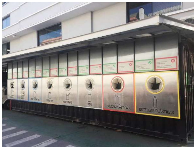
Imagen del Centro de Acopio para Residuos no Peligrosos en Beauchef.

ReBeauchef, se hace cargo del reciclaje de los residuos sólidos domiciliarios, implementando un sistema conformado por puntos intermedios, donde se acopia botellas PET, latas, tetrapak y bolsas plásticas. Y un Centro de Acopio donde se separan corrientes de residuos sólidos, como lo son el cartón corrugado, cartón dúplex, diarios, revistas, tetrapak, papel blanco, latas, botellas PET y latas de conserva.