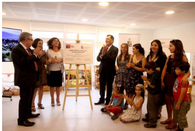
Imagen de la Inauguración del Jardín Infantil y Sala Cuna "Campus Beauchef" el 2018.

El 2018, se crea el Instructivo de Uso de Nombre Social "Mara Rita" , el cual es un documento que permite que personas trans que estudian o trabajan en la Universidad de Chile puedan utilizar su nombre social en registros, documentos y comunicaciones verbales y escritas para efectos internos, en ámbitos curriculares, extracurriculares y laborales.