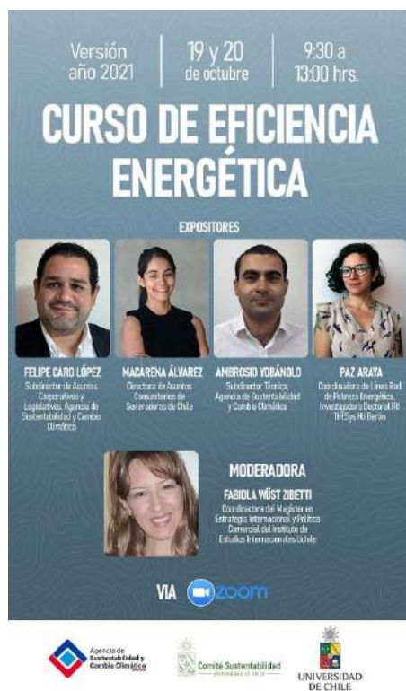
Imagen del curso de eficiencia energética 2021 para docentes UCh.