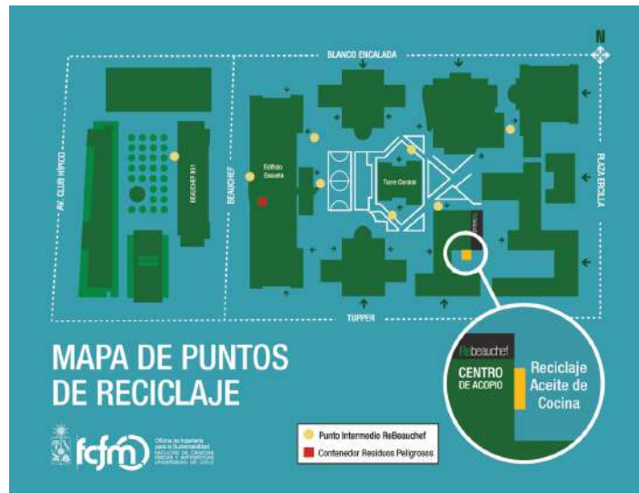
Imagen del Mapa de los Puntos de Reciclaje en FCFM.

ReBeauchef, se hace cargo del reciclaje de los residuos sólidos domiciliarios, implementando un sistema conformado por puntos intermedios, donde se acopia botellas PET, latas, tetrapak y bolsas plásticas. Y un Centro de Acopio donde se separan corrientes de residuos sólidos, como lo son el cartón corrugado, cartón dúplex, diarios, revistas, tetrapak, papel blanco, latas, botellas PET y latas de conserva.