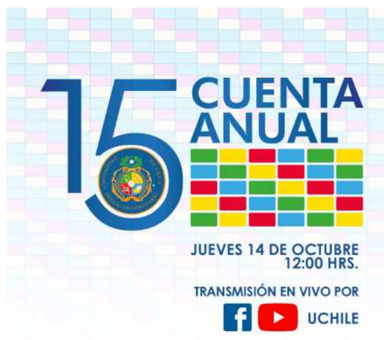
Imagen del cumplimiento de 15 años del Senado Universitario y su cuenta anual correspondiente al 2021.

2018-2022 por el rector que lo preside, y por 36 miembros, de los cuales 27 son académicos, 7 estudiantes y 2 representantes del personal de colaboración.