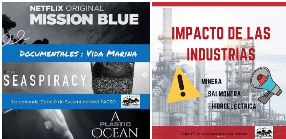
Imágenes de difusión por redes sociales del Comité Local de Unidad Sustentable CLUS FACSO.

Además, la Facultad de Ciencias Sociales cuenta con un grupo activo de estudiantes que se dedican a promover la sustentabilidad, organizados en la Comisión de Medioambiente FACSO desde el 2013, la cual es una organización estudiantil autónoma que autogestiona todo tipo de actividades en torno a lo socioambiental. Sus principales ejes de trabajo son la autoformación (Escuela Socioambiental), huerto y compostaje (Jornadas de huerto, intercambios de semillas, compostaje), y extensión y vinculación con el medio. Durante el 2021 principalmente realizaron la Escuela Socioambiental, reuniones abiertas, participación en Huelga Global Climática y actividades de difusión. También, el CLUS FACSO se ha dedicado a la difusión de material infográfico en torno al impacto de las industrias (minera, salmonera, hidroeléctricas), especies en peligro de extinción en Chile, especies nativas y endémicas de Chile, recomendación de películas que abordan temáticas socioambientales, y documentales de la industria chilena (salmoneras, forestales, y impacto hídrico de la palta), entre otros.