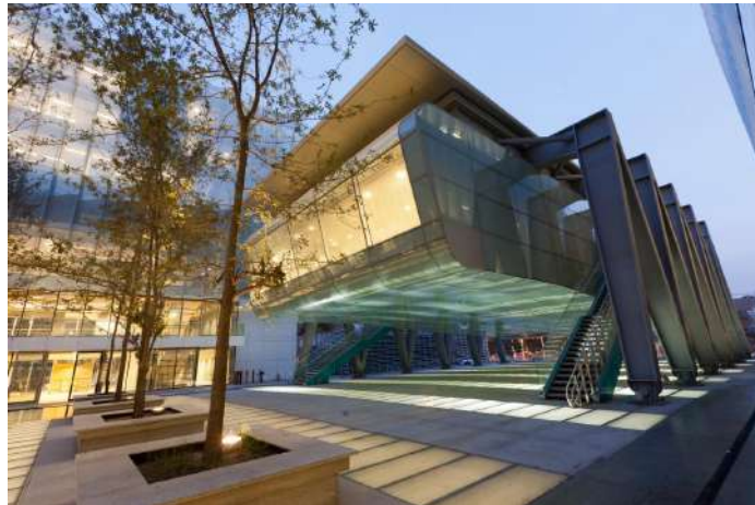
Imagen de Beauchef 851.

El Campo Deportivo del Campus Juan Gómez Millas inaugurado el 2017 para estudiantes, funcionarios y académicos es otra iniciativa que destaca por su infraestructura, en este caso, por ser adaptada para personas con discapacidad física y ceguera. Este campo deportivo en su área exterior cuenta con una cancha reglamentaria de fútbol y rugby,