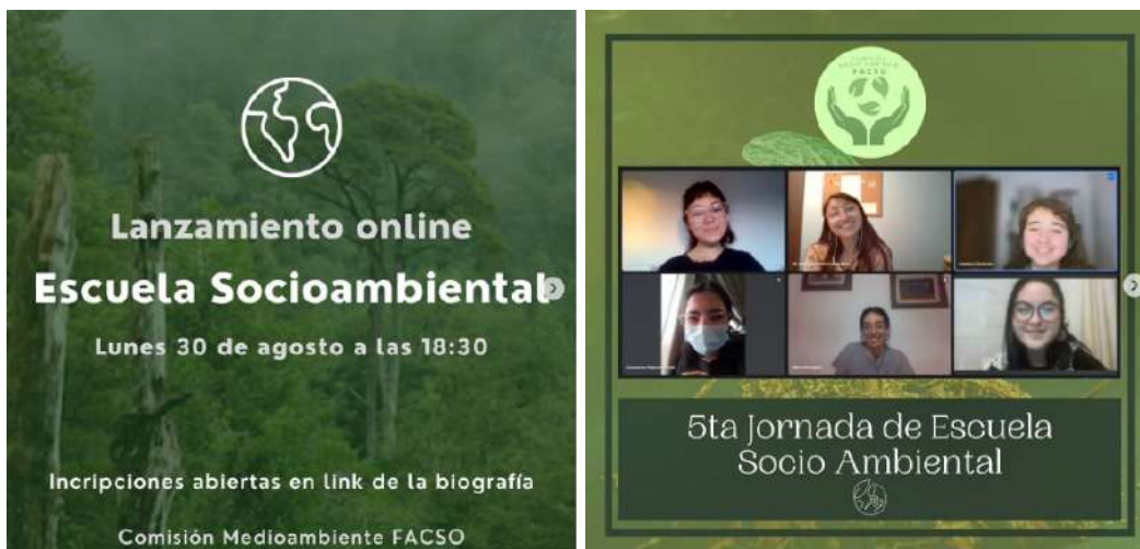
Imágenes del lanzamiento de la Escuela Socioambiental 2021 y una de sus jornadas.

Este espacio cuenta con la presencia de monitores/as o tutoras los cuales guían las discusiones y conversaciones. La escuela socioambiental se propone como espacio horizontal donde todas las personas que participan son co-constructoras de la formación de sus pares, el aprendizaje es mutuo y colaborativo.