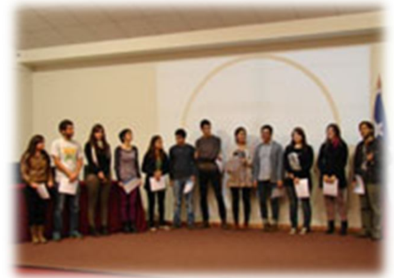
Certificación de Tutores, Campus Sur

Acompañamiento en los procesos de adaptación y generación de vínculos a las redes existentes.