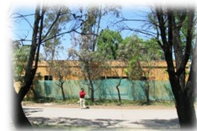
Centro Enseñanza- Aprendizaje Campus Sur en construcción

UCH1112: Hacia una política de equidad e inclusión (2012 – 2013).