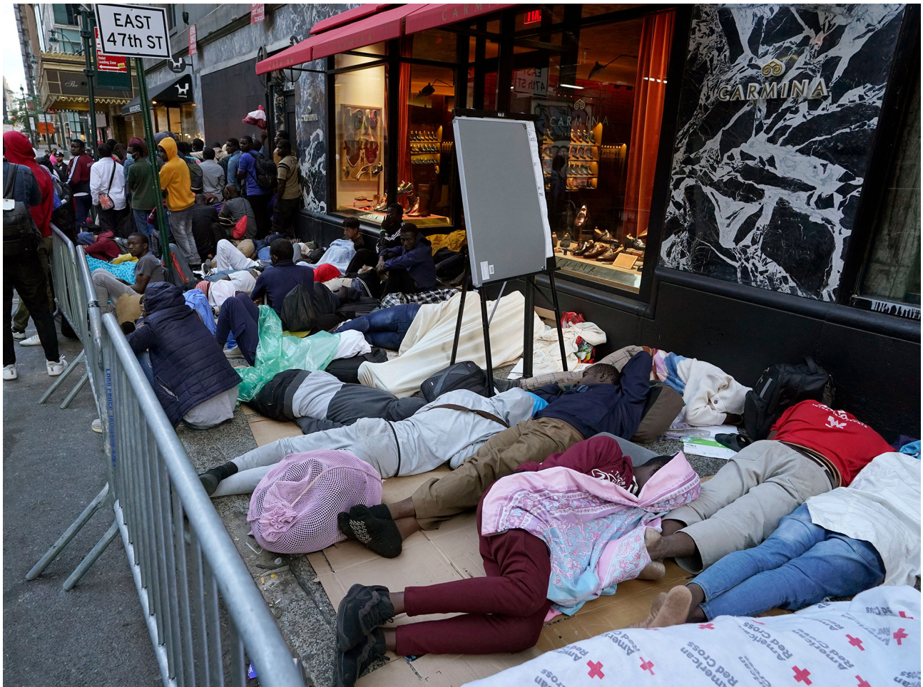
Inmigrantes en el centro de Manhattan, New York.