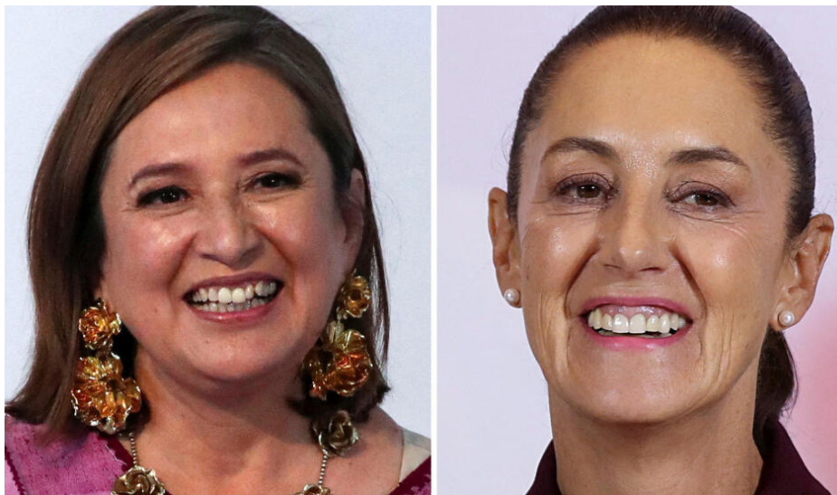
Las candidatas Xóchitl Gálvez y Claudia Sheinbaum, respectivamente.

Más allá de las visiones ideológicas, de la eventual influencia de AMLO e incluso de los vaticinios de los analistas, no es posible predecir el papel que finalmente adoptará la futura presidenta y el futuro gobierno frente a todos los temas del próximo sexenio. No se puede presumir subordinación o tutela alguna, porque esta elección, con rostro de mujer, puede ser también el punto de partida de un nuevo estilo, de una visión renovada, de un nuevo liderazgo femenino autónomo que marque un cambio profundo respecto de la tradicional cultura machista de la política mexicana. En los próximos años, la mujer en México tendrá la oportunidad y también tendrá el poder de abrir un camino propio.