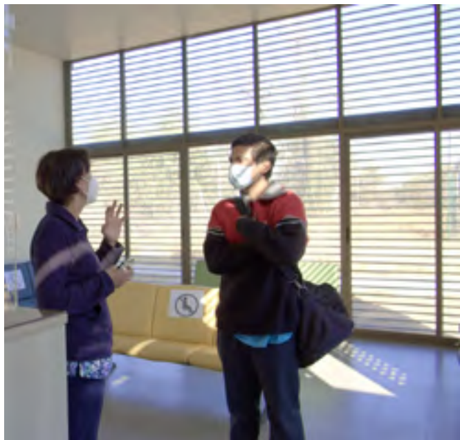
Recepción del nuevo edificio de SEMDA Campus Sur