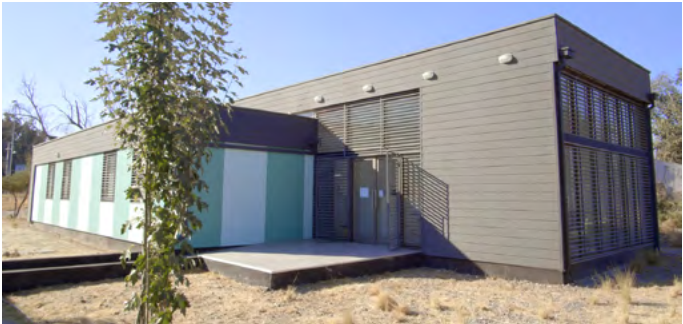
Nuevo edificio de SEMDA Campus Sur

Esperamos contar con el recinto operativo a finales del año 2022.