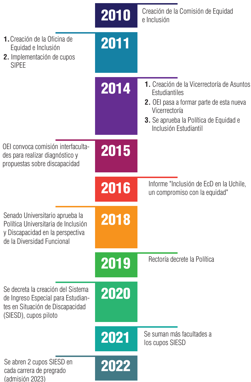
Figura 3. Trayectoria de la Universidad de Chile en el abordaje de la discapacidad Para su descripción remitirse al anexo en página 118