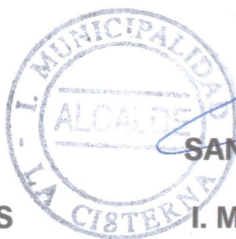
SANTIAGO REBOLLEDO PIZARRO ALCALDE I. MUNICIPALIDAD LA CISTERNA