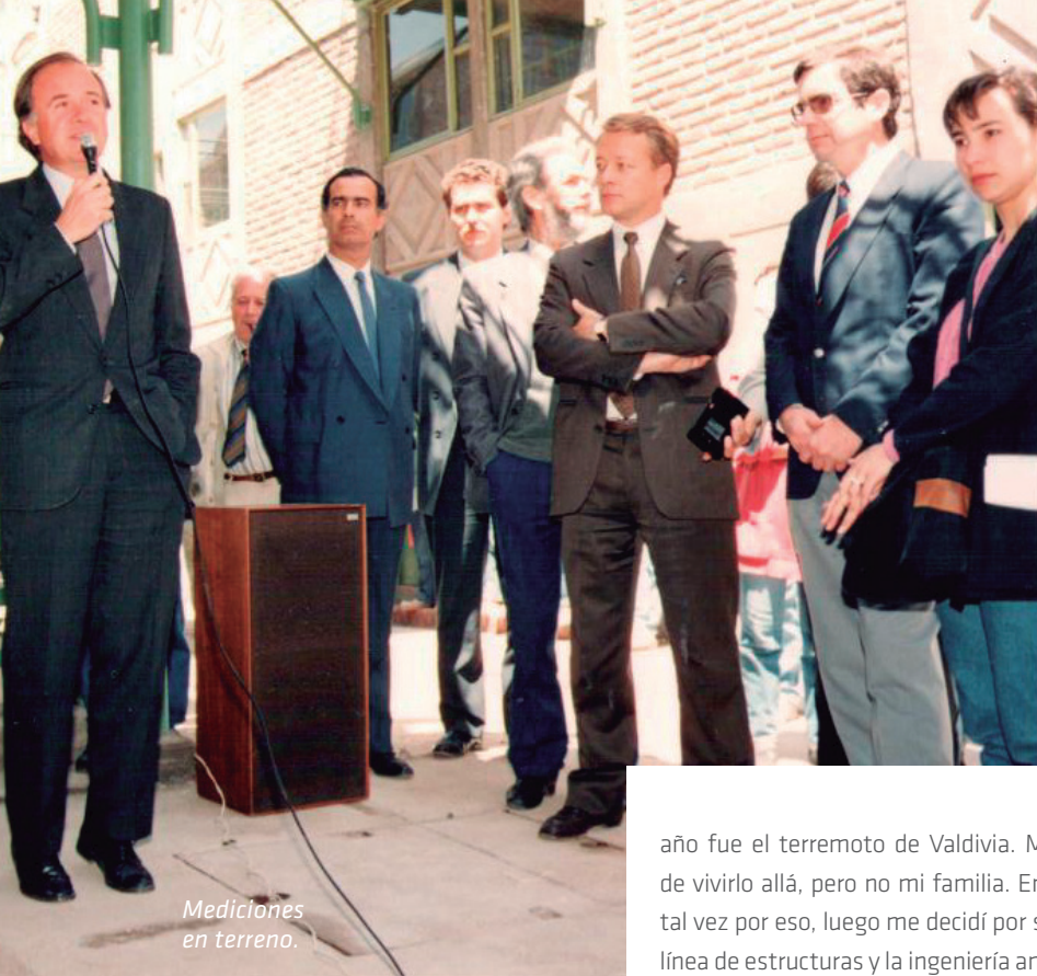
Mediciones en terreno.